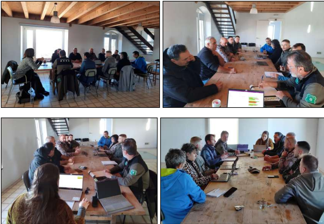
Imatges de la reunió realitzada el 08/11/2023