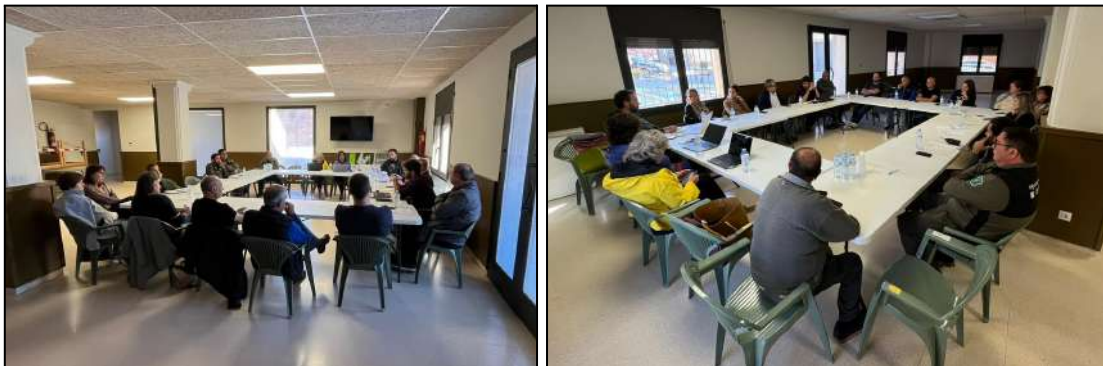
Imatges de la reunió realitzada el 27/10/2023