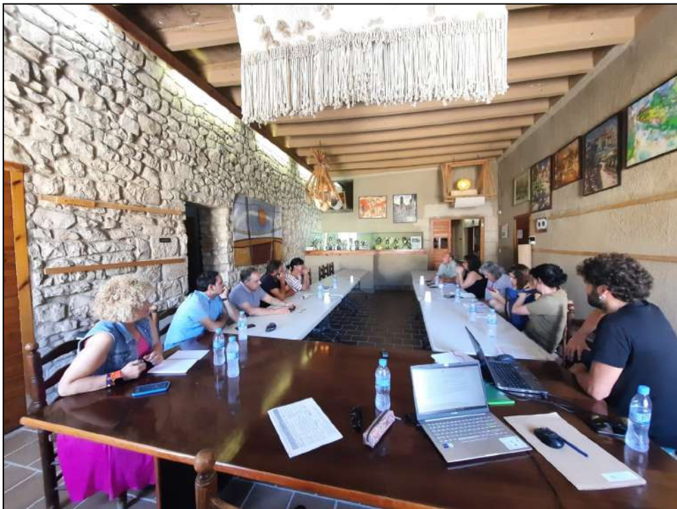
Imatge de la reunió realitzada el 16/07/2023