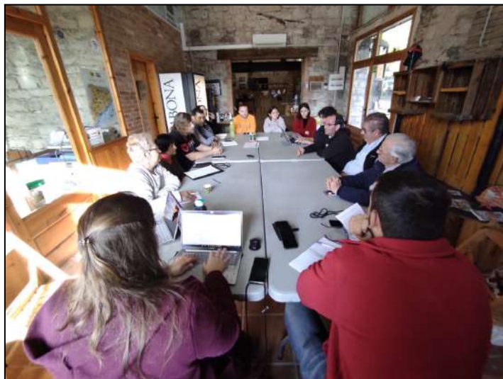
Imatges de la reunió realitzada el 13/11/2023