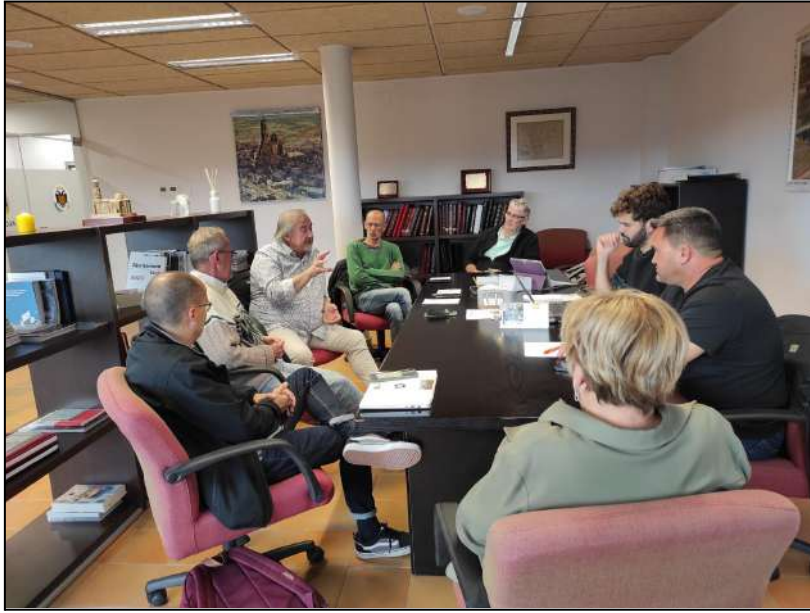
Imatge de la reunió realitzada el 02/11/2023